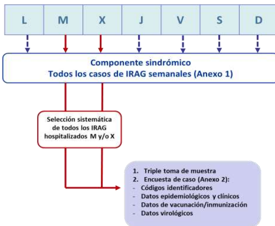
Figura 2. Esquema de recogida de información en los casos semanales de IRAG y en los IRAG hospitalizados M y/o X seleccionados sistemáticamente