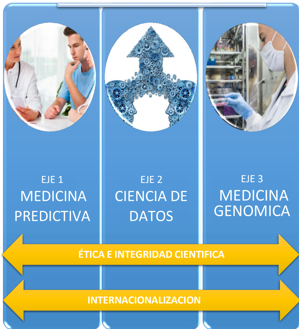
Figura 1. Ejes estratégicos IMPaCT